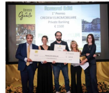
Ceresio in Giallo: il momento della premiazione