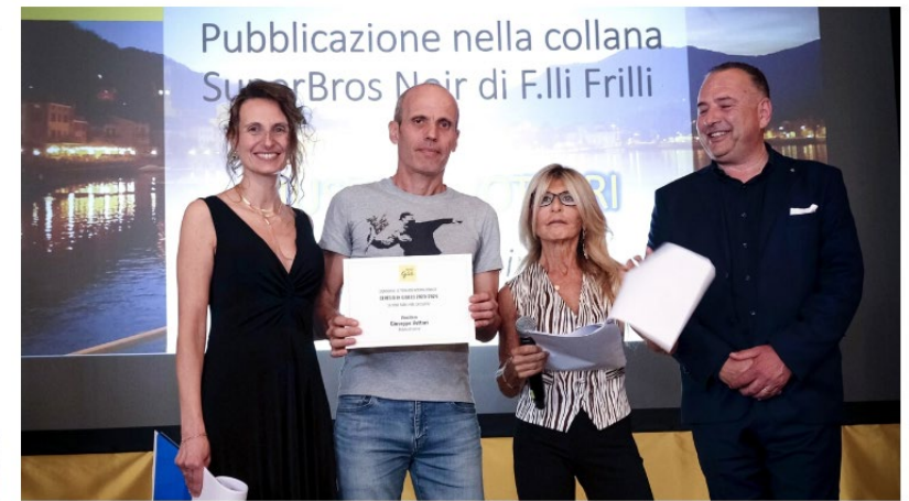
Un momento della premiazione del Concorso

La cerimonia di premiazione si è svolta nei giardini di palazzo Estense a Varese