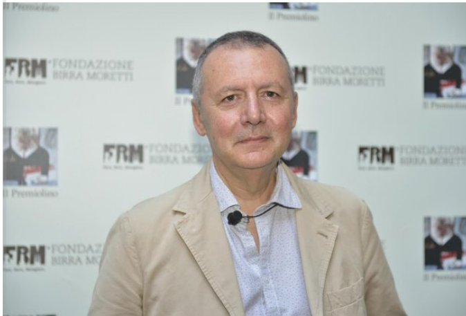
↑ - RIPRODUZIONE RISERVATA

Verrà consegnato domenica 26 maggio a Varese