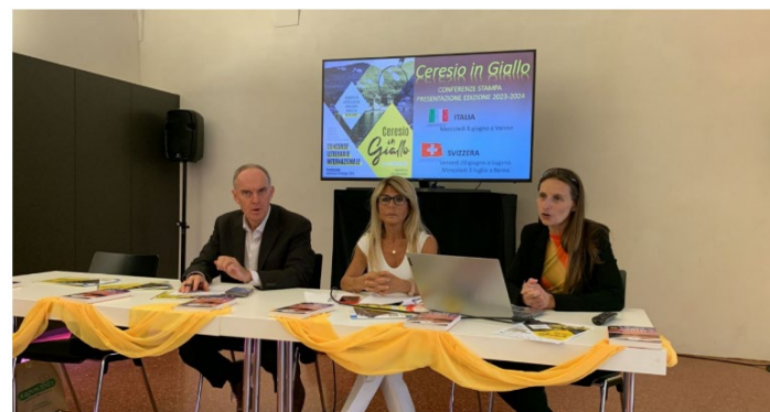
La presentazione al Lac